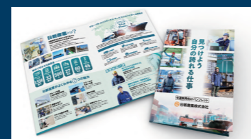
教育マニュアル ブログ更新 ホームページ パンフレット